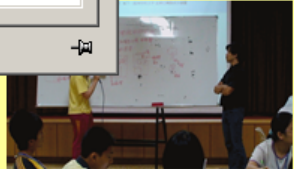
99年度全國高中職學生創意閱讀營